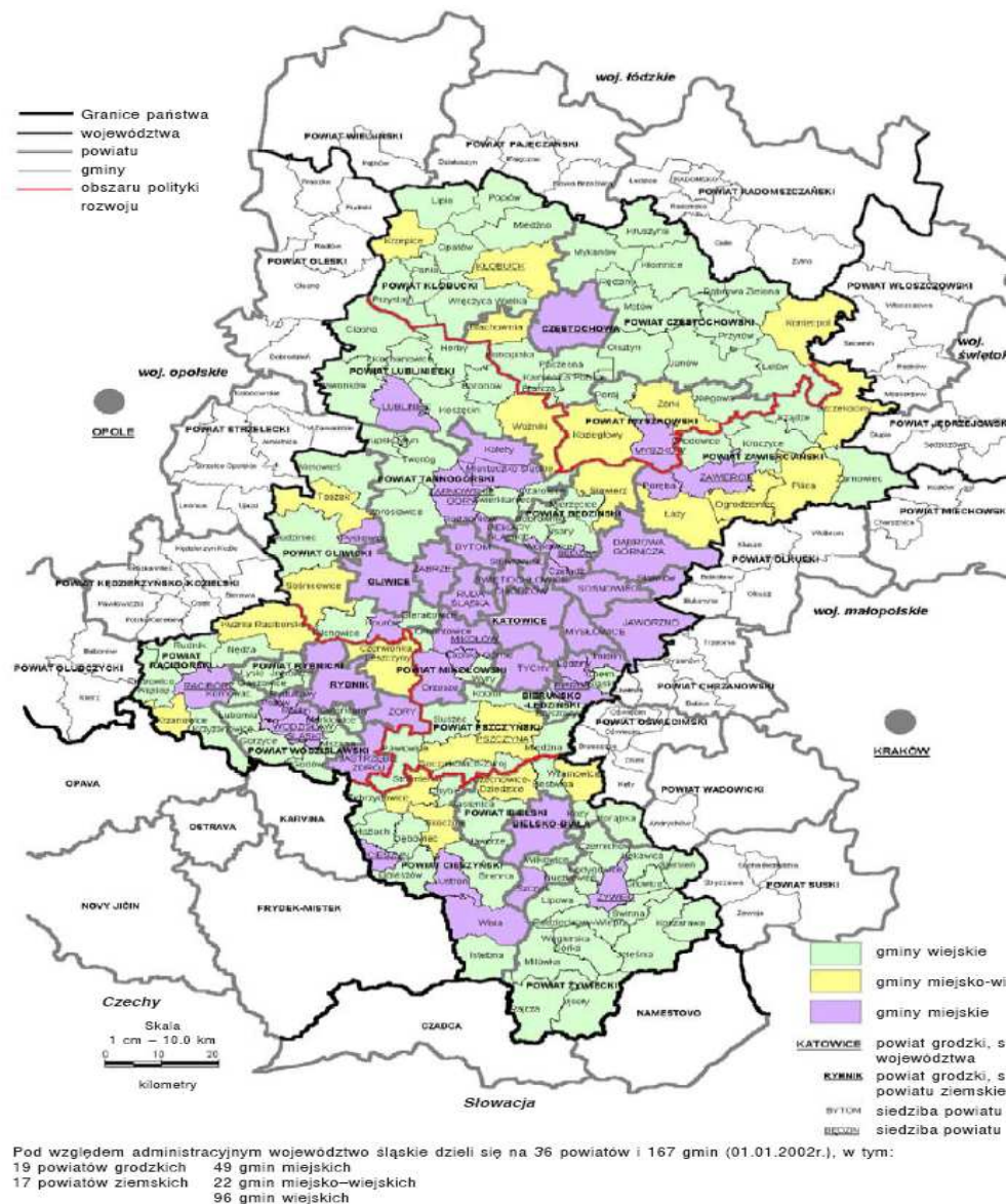
Rysunek 1: Mapa Województwa Śląskiego.